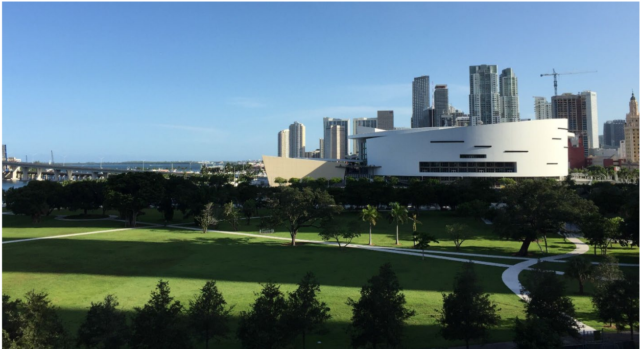
Kaseya Center (Miami-Dade County)