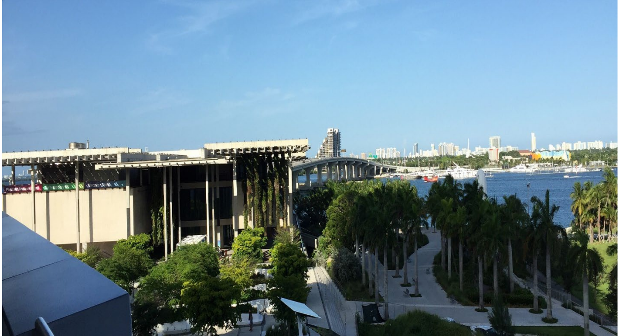
Pérez Art Museum Miami (PAMM)